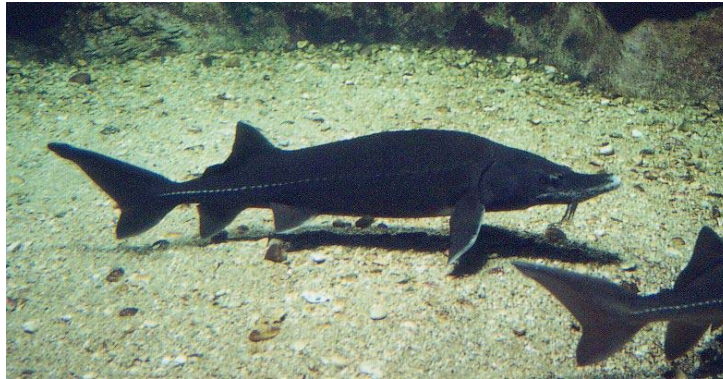
Poisson spatule ou Polyodon