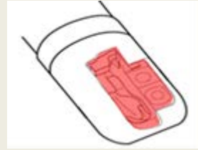
Figure 1 : Extrémité distale du duodéroscope Zone ne devant pas entrer en contact avec le désinfectant lors de la désinfection des surfaces externes

Procéder à la désinfection à l'alcool à 70° des surfaces externes de l'extrémité distale du duodéroscope susceptibles de pouvoir rentrer dans le flacon de recueil lors du prélèvement, en veillant à ce que l'érecteur et les surfaces situées de chaque côté et derrière l'érecteur n'entrent pas en contact avec l'alcool (cf figure 1).